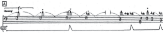
Ejemplo 3. Sequenza V , para trombón solo, Luciano Berio, (adaptado de Stoianova, 1985: 408).

ciar la palabra why? , con la expresión de desconcierto. Se trata de una cita, una referencia a Grock que, de acuerdo con el testimonio de Berio, en sus presentaciones interrumpía en un cierto momento las payasadas y dirigía a la platea la pregunta. El efecto era fuerte y Berio reporta que no sabía si se reía o se lloraba. En Sequenza V la pregunta marca el inicio de la segunda parte de la obra, que el músico ejecuta, a partir de ese momento, sentado.