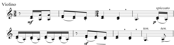
Ejemplo 1. La historia del soldado , Música para escena I, violín, compases 7-15.

no está sugerida al oyente por medio del lenguaje verbal, presente en la narración. Son los gestos musicales presentes en la partitura compuesta por Stravinsky los que lo hacen, significativos por la corporeidad del movimiento musical en la marcha y por la indicialidad de los motivos que apuntan al movimiento del brazo con el arco sobre las cuerdas del violín. La recurrencia de ese gesto en otras partes de la obra formaliza los elementos del signo que pasa a funcionar como símbolo del soldado y su alma en distonía.